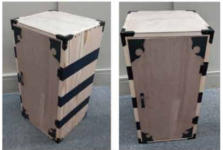
※上記はイメージ写真です。告知無く仕様変更になる場合がございます。